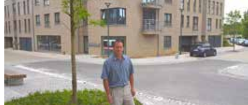
Verder verbetering van uw omgeving p. 3