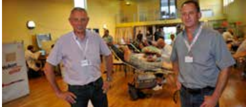
N-VA-schepenen geven 200 x bloed p. 2